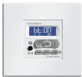
S 400 BT