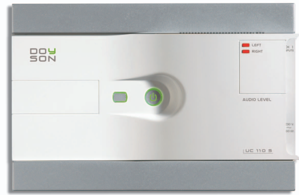
UC 100 S

CABLE REF. W-8P SECCIÓN MÍNIMA 2X1MM 6X0,25 MM