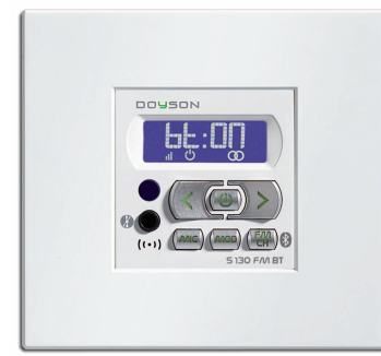
S 130 FMBT

TOMA DE ANTENA* cable 80cm largo 1mm sección