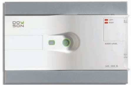
UC 100 S